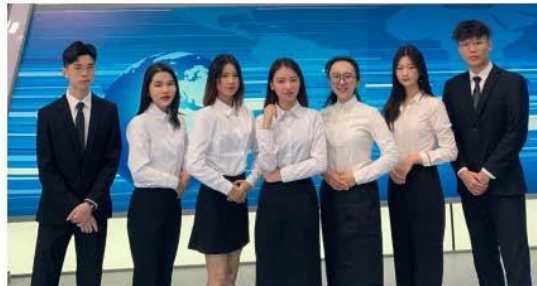
学生“蜜月人生”创业团队

学校作为广东省大学生创新创业示范校，始终把创新创业教育贯穿人才培养全过程，将创新创业课程纳入人才培养方案，推动创新创业的“课堂革命”，实现全员全程全方位育人。学校构建了“五核五递进”创新创业人才培养生态系统，每年聘任双师型、企业在岗的创业创新导师，面向全校学生开设线上与线下相结合的《创新创业教育》公选课，面向相关专业学生开设专创融合的创新创业先锋班课程，面向毕业班学生开设SYB（Start Your Business）创业培训；实施“赛、教、学、创”四位一体的育人机制，以赛促教、以赛促学、以赛促创，让学生投入到创新创业竞赛中，以项目驱动实现创新创业人才的培养。