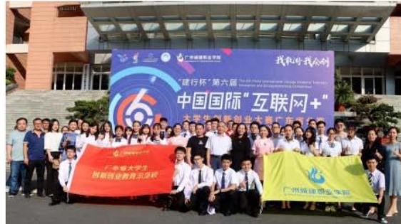
参赛选手与校长合影留念

全国大学生电子商务创意及创业挑战赛国家级一等奖、第三届广州市“职教杯”一等奖1项，众创杯铜奖1项，“赢在广州”创新创业大赛优胜奖1项，从化区特等奖1项。