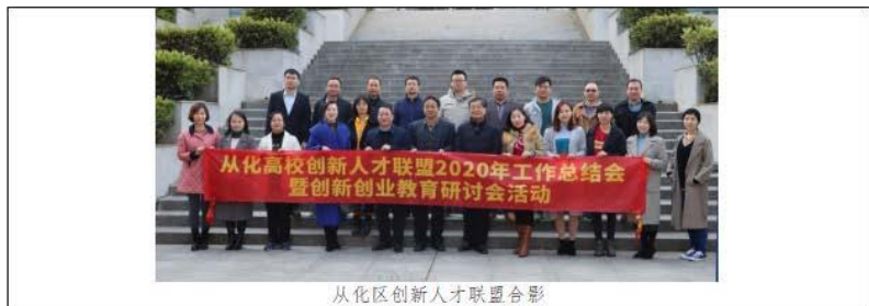
从化区创新人才联盟合影