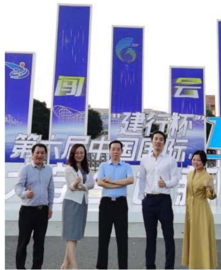
第六届中国国际“互联网+”大学生创新创业大赛