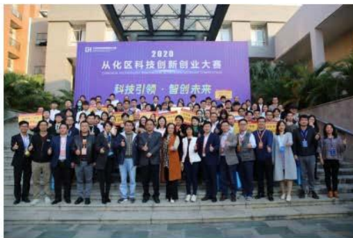
2020年从化区科技创新创业大赛合影留念

2020年12月8日，从化区科技创新创业大赛决赛在广州城建职业学院会议中心第二报告厅圆满落幕。此次大赛由从化区科技工业商务和信息化局主办，广州城建职业学院承办。本次大赛设置创意组和企业组，参赛团队来自从化区各大高校及企业，共有192个创意组和20个企业组项目通过资格审查，经过专家评委的严格评审，最终共有20个项目晋级现场决赛。经过激烈的角逐，分别产生创意组、企业组特等奖各1名，一等奖各2名，二等奖各3名，三等奖各4名。最终广州城建职业学院获得特等奖1项，一等奖1项，二等奖2项，三等奖2项，并获得广州市从化区科技工业商务和信息化局发函感谢。创业大赛不仅仅是一场比赛，而是成为了一场创新的交流与思维碰撞的盛宴。20个项目不仅体现出学生和企业青年的创新创业思维，同时也体现了从化区当代青年人有能力有担当的精神风貌。