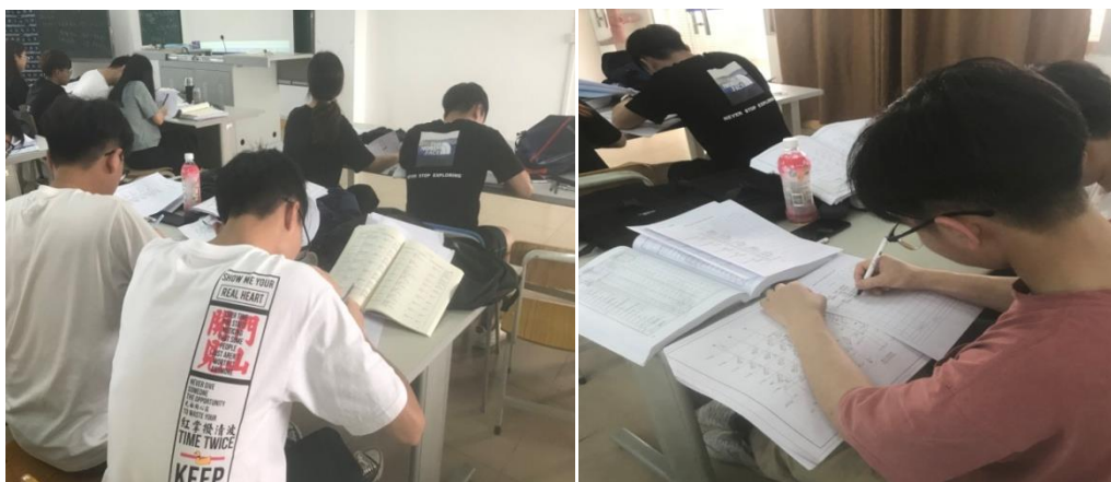
图 3 课堂实操训练

2. 根据学生实际情况制定考核对策。高职学生的学习能力较弱、学习习惯差，注意力不集中，如何减少学生玩手机的现象，我会让学生闲不下来，让学生累起来。根据和班干部聊天得知，学生抄作业情况严重。我在讲完关键知识点后，马上布置课堂实训任务（见图 3），下课交成果，不得补交作业。每次作业成果占期末考核分数的 3 分，根据学时安排，本学期我任教的课程《安装工程计量与计价》共要完成 12 次作业，合计 36 分，作业和出勤考核共计 50 分，学生只要不集中精神上课就无法完成课堂作业，不交作业成果就没有办法通过考核，学生上课不敢松懈。