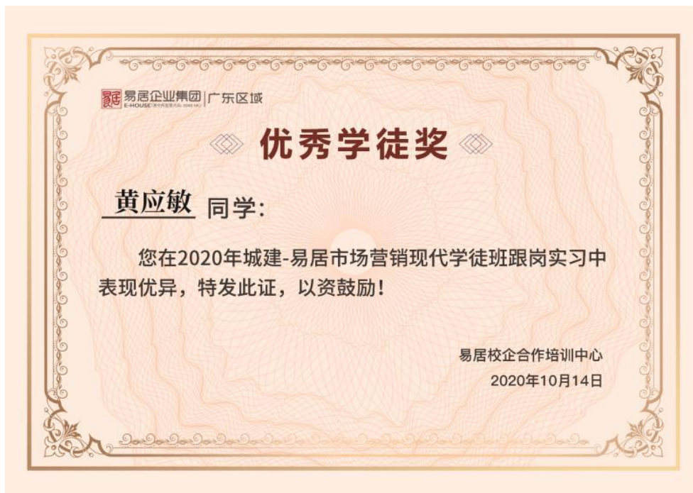
优秀学徒获奖证书