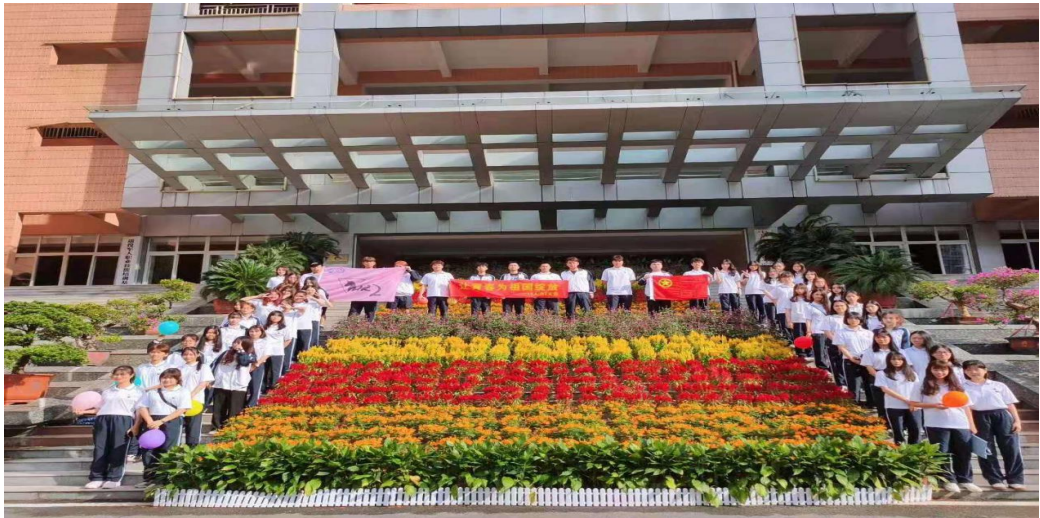
“活力在基层” 团日活动