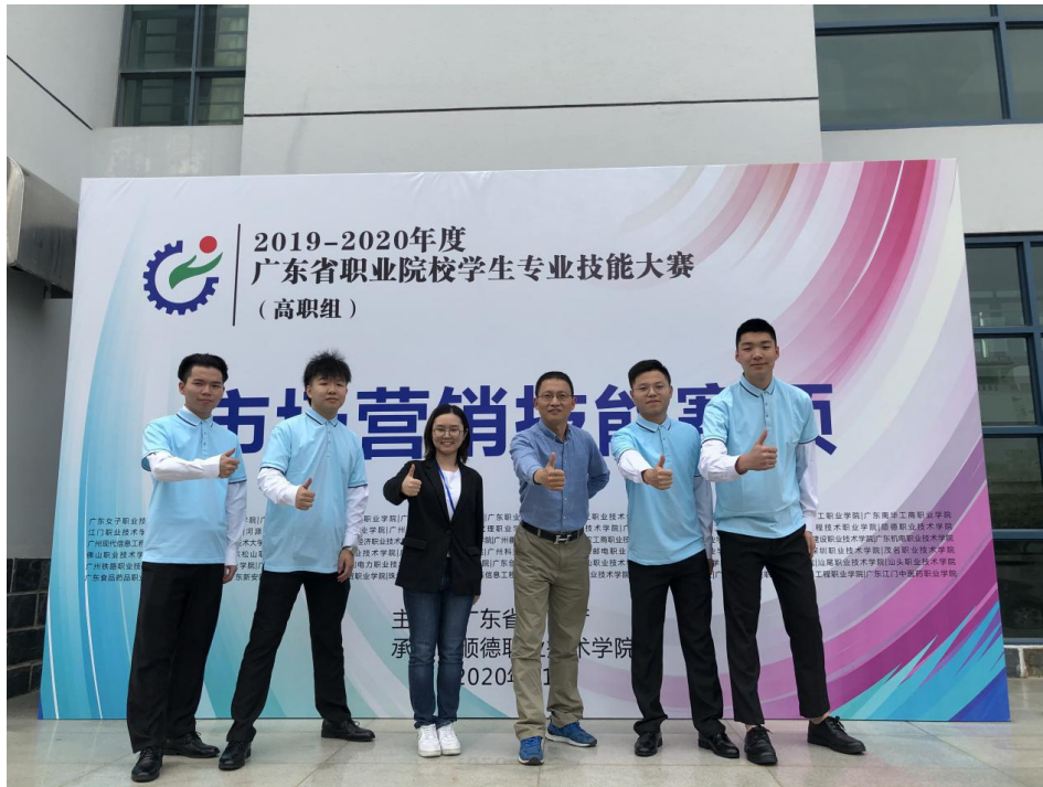
市场营销技能竞赛团队