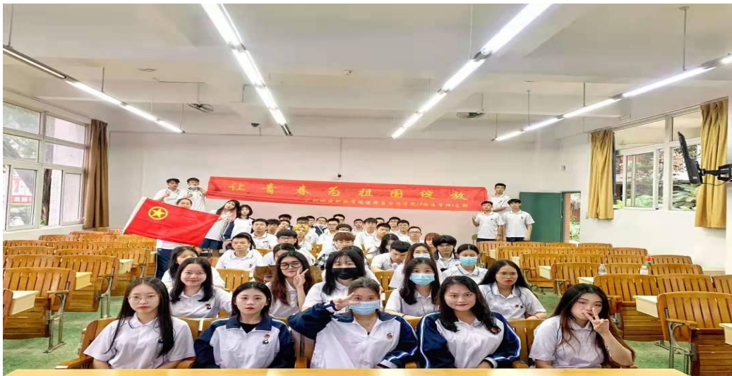
17 财务管理 2 支部开展团日活动