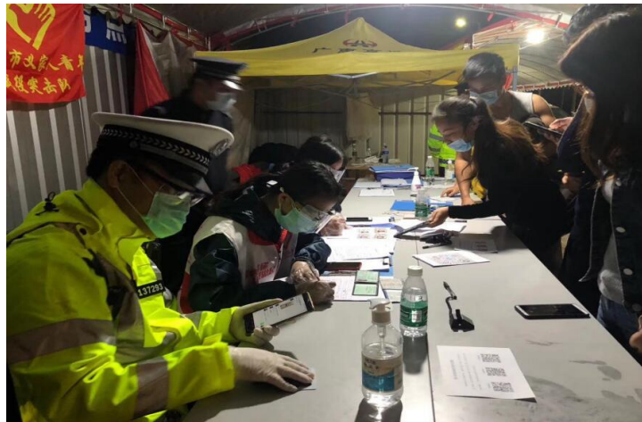
学院党员参加高速收费站疫情防控